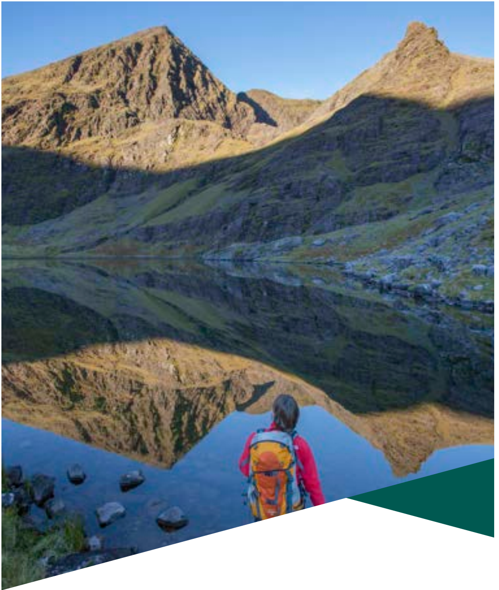
Cruinniú Mullaigh Cheathrú an Tuathail, Co. Chiarraí