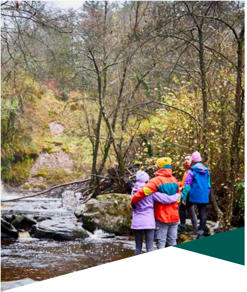
Gleann Bearú, Sliabh Bladhma, Co. Laoise