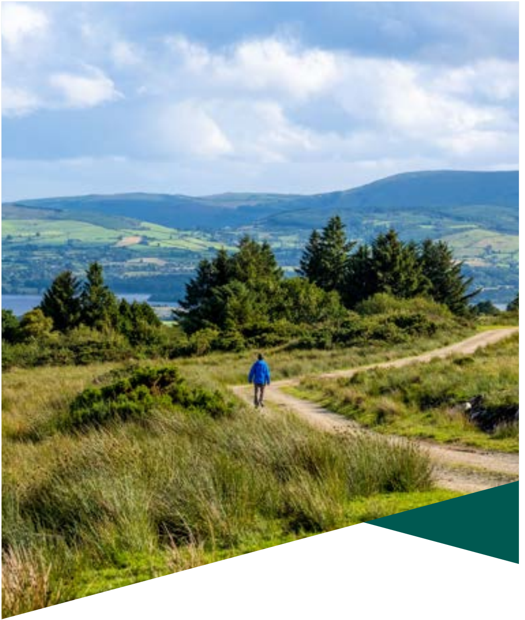
Baile Uí Bheacháin, Co. An Chláir