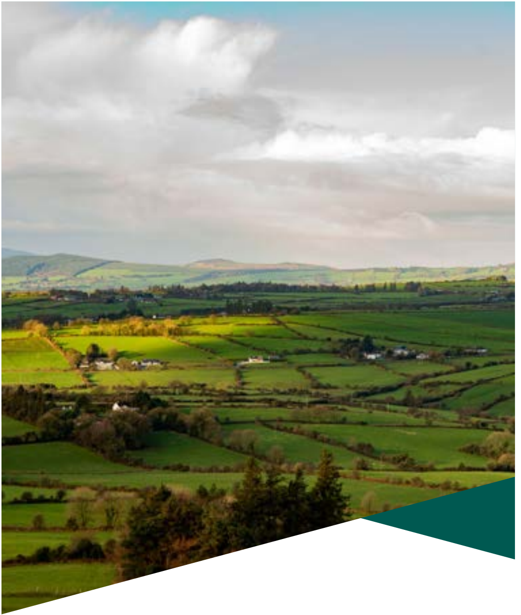
Paradise Hill, Co. Luimnigh