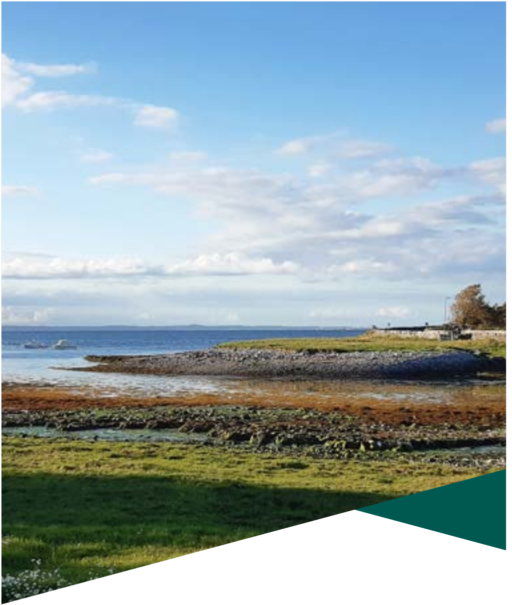
Baile Uí Bheoláin, Loch Deirgeirt, Co. An Chláir